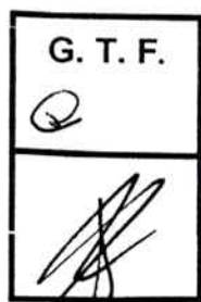
Dn. VICENTE FILOSA Ministro de Coordinación de Gabinete